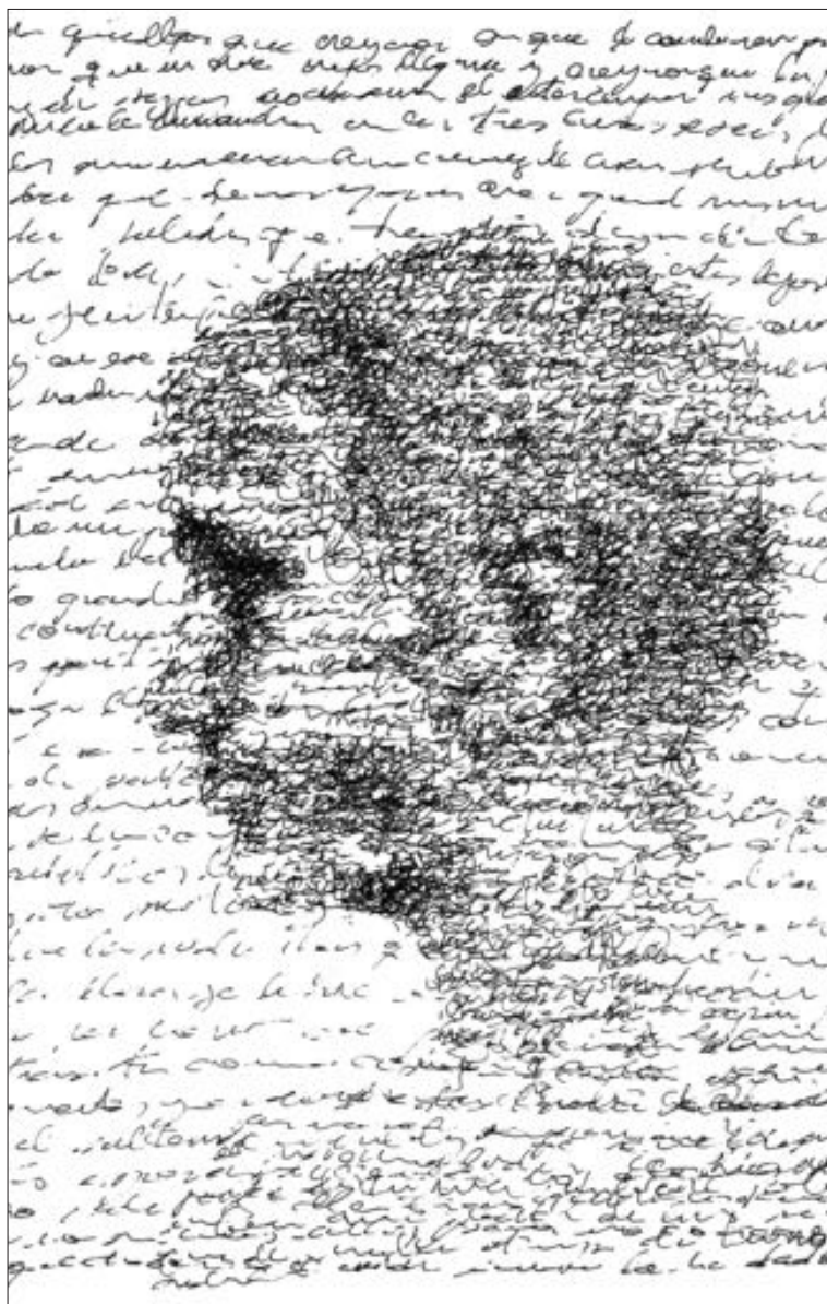
Ilustración: Xavier León Borja • La vida se pasa volando